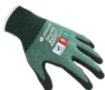
AIRFLOW/CUT B 100216