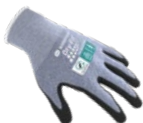
AIRFLOW/LIGHT GRIP 100213