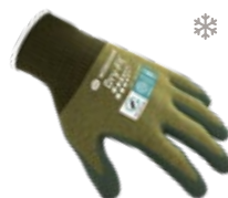
AIRFLOW/COLD WOOL 300252