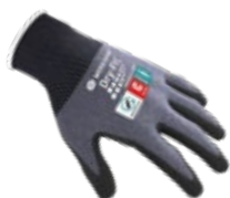
AIRFLOW/CUT C GRIP 100218